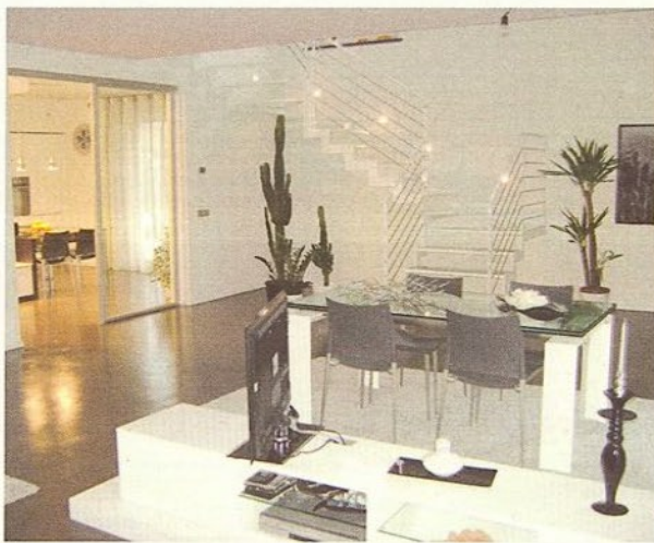
Sotto il rendering di un ristorante e sopra un interno realizzato

«Dipende dal tipo di intervento e dalla sua complessità. Diciamo che generalmente in un interno sia residenziale che commerciale, di intrattenimento o alberghiero,